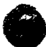
2. Sextus Pompeius