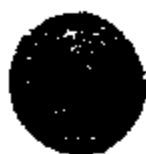
1. Julius Caesar